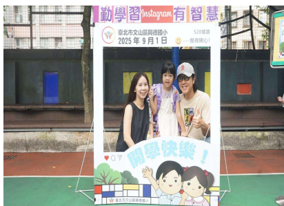
新生與家人們拍照打卡