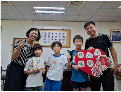
校長、輔導主任與新生合影

3. 9/3(三)進行轉入生輔導活動，輔導室帶領三位新轉入生認識學校各處室及校園環境。