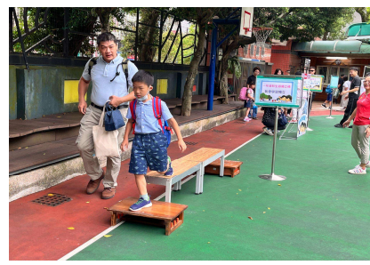
新生家長帶小朋友過獨立橋 期盼孩子學會獨立