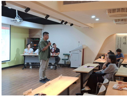
家長會長介紹家長會事務