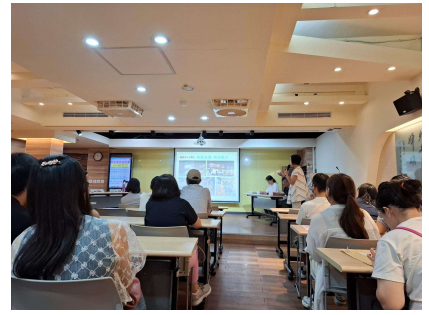
處室主任說明學校行政規劃

3. 9/3(三)進行轉入生輔導活動，輔導室帶領三位新轉入生認識學校各處室及校園環境。