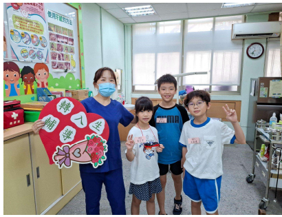
轉入生認識健康中心