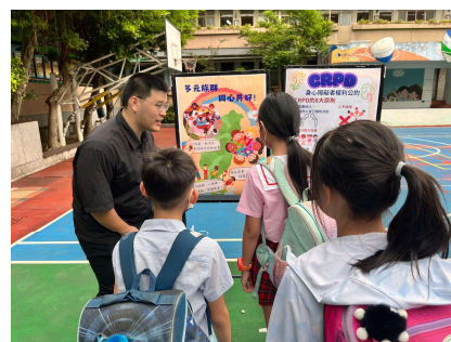
多元文化海報宣導