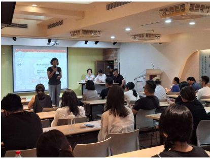
校長歡迎家長參與座談會