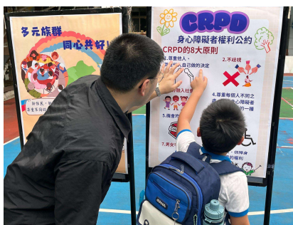
身心障礙者權利公約(CRPD) 海報宣導