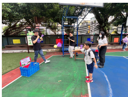
新生投擲毬球參加闖關活動 我是神射手-我會學習專注