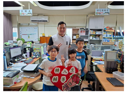
轉入生認識各處室所在位置