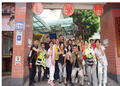
校長、家長會長、志工和學校同仁 一同在校門口迎新